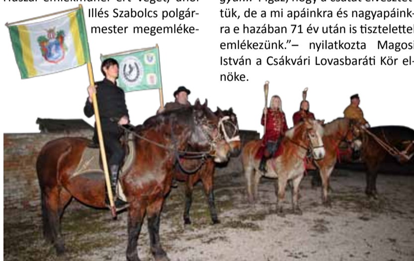
Dízsorsfal a Huszár-emlékműnél