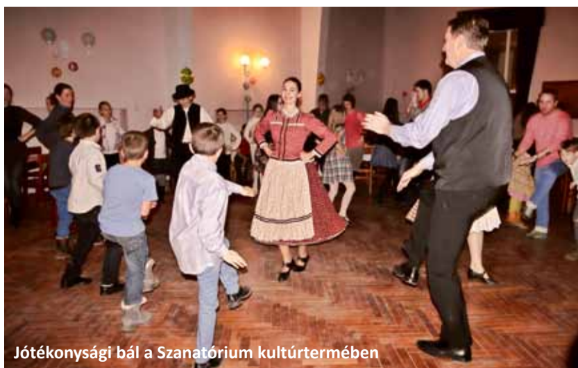
Jótekonysági bál a Szanatórium kultúrtermében