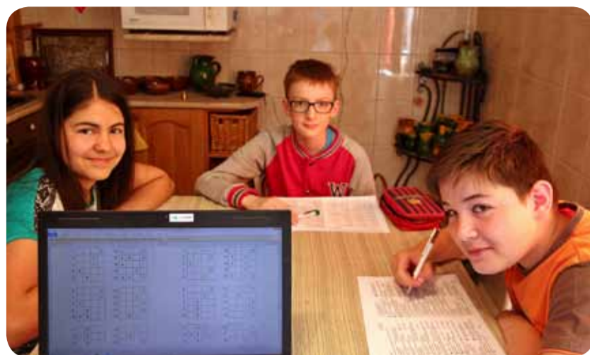
A Káti Márk történelemversenyre készülő diákok