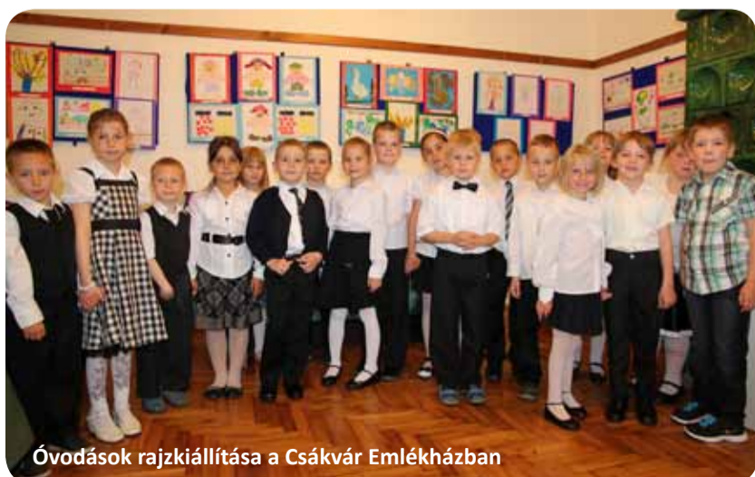
Óvodások rajzkiállítása a Csákvár Emlékházban