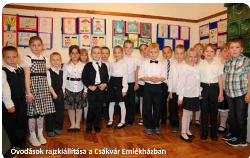
Óvodások rajzkiállítás a Csákvár Emlékházban