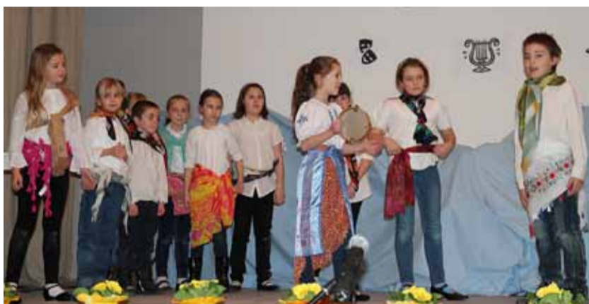
Esterházy Iskola dráma szakköre

(Köszönjük Kaszap Imréné Mártinak a virágdekorációt, Szakál Borostyánnak a konferálást Németh Istvánnak a fotókat, Horváth Józsefné Margitka és Hartégen Gyula önzetlen felajánlását a fellépők megvendégelésére)