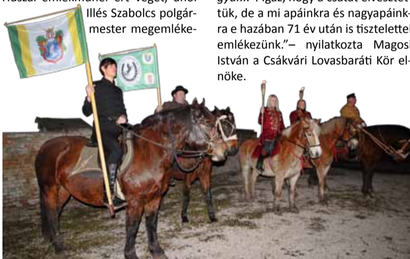
Dízsorsfal a Huszár-emlékműnél