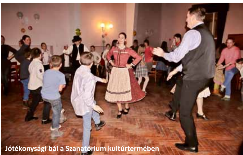
Jótekonysági bál a Szanatórium kultúrtermében