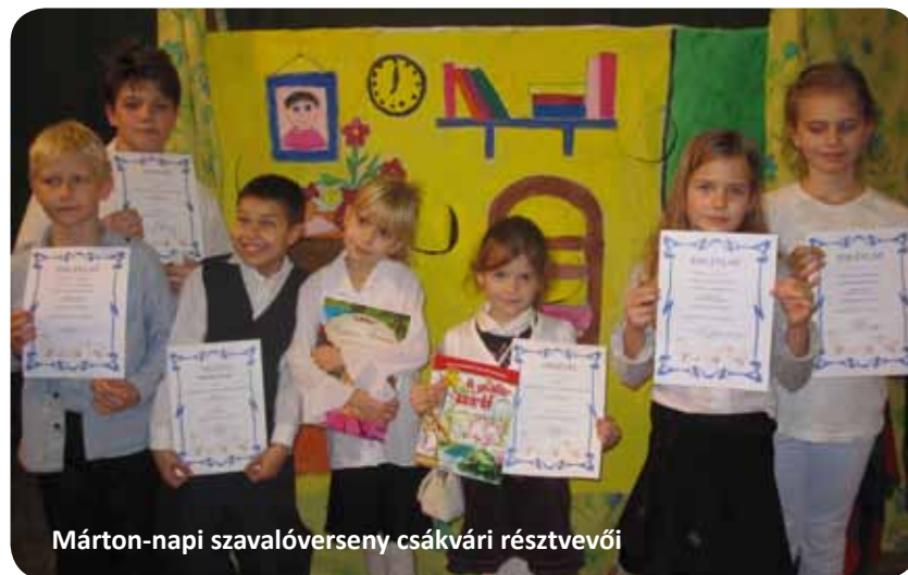
Márton-napi szavalóverseny csákvári résztvevői