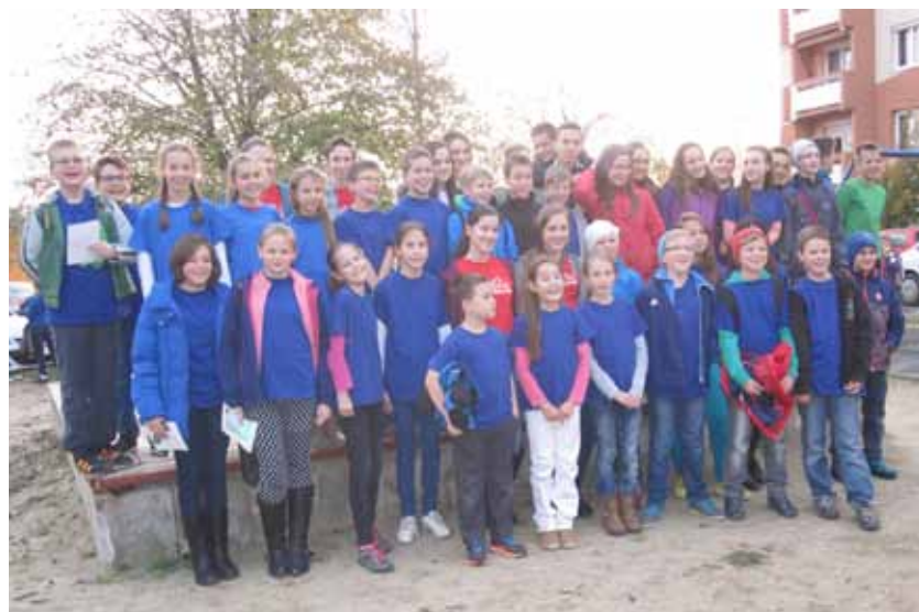
A Bolyai Anyanyelvi Csapatversenyen indult csákvári diákok

Ez a kép, a 2015/2016-os tanév első jelentős magyar nyelvtani és irodalmi versenye után készült Székesfehérváron, a kis Telekinek nevezett Sziget Utcai Általános Iskola épülete mellett. Látható, hogy sok-sok csákvári tanulót megmozgatott a verseny. Nemcsak a mi iskolánkban népszerű ez a színvonalas megmérettetés. Korosztályonként 30-40 csapat indult, akik a megye három városában: Bicskén, Dunaújvárosban és Székesfehérváron válaszoltak a kérdésekre. A hetedik és nyolcadikosok mezőnyében külön értékelték az általános iskolásokat és a gimnazistákat. A feladatok megoldása többféle ismeretet várt el a tanulóktól: lexikális tudást, nyelvi játékok iránti fogékonyságot, logikus gondolkodást, együttműködési készséget, nagy figyelmet és precíz-