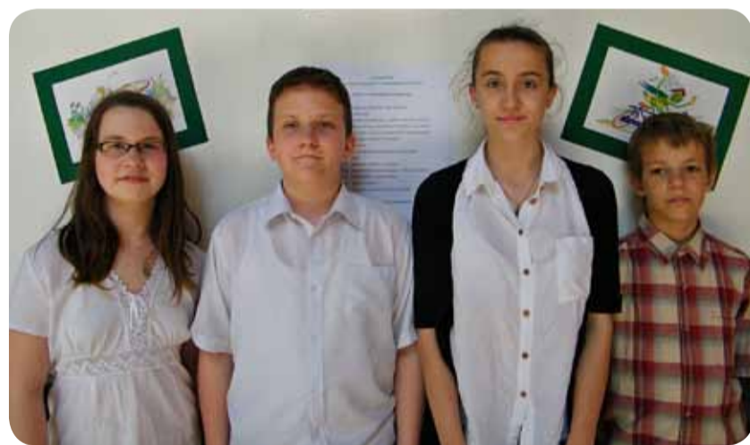
A nyelvész országos döntőjének csákvári helyezettjei